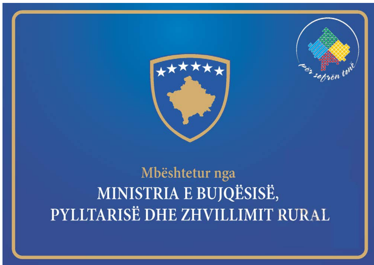
Shtojca 16: Logo -Promovimi