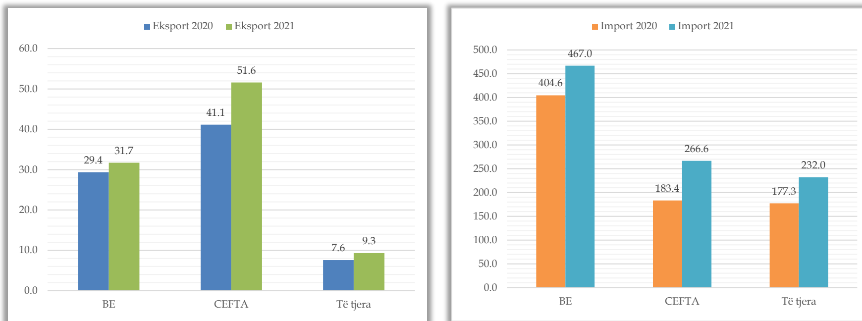
Figura 2: Shkëmbimi tregtar sipas grupit të shteteve, vlera në mil. €